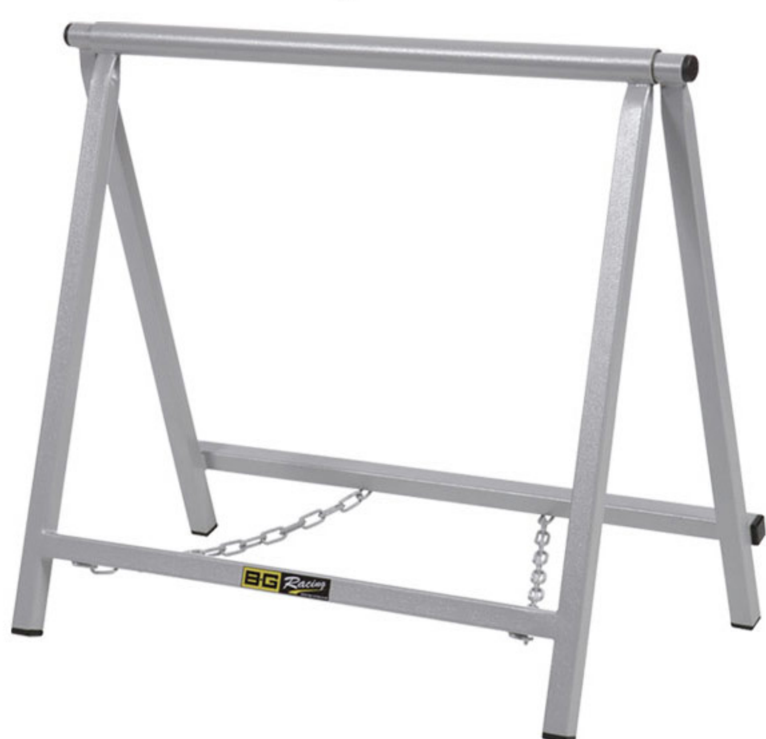
BGR126P / BGR126RED