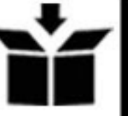
BGR125P / BGR125RED