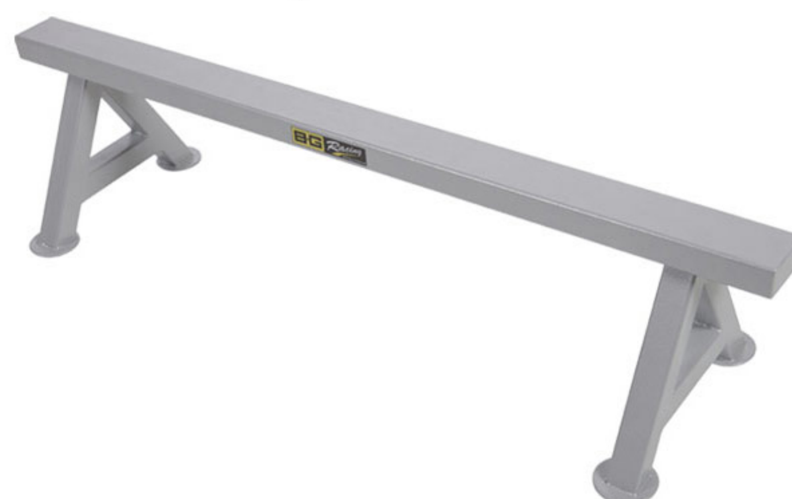
BGR127P / BGR127RED