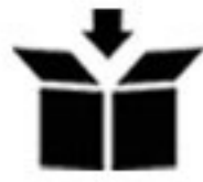
BGR128P / BGR128RED