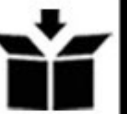
BGR127P / BGR127RED