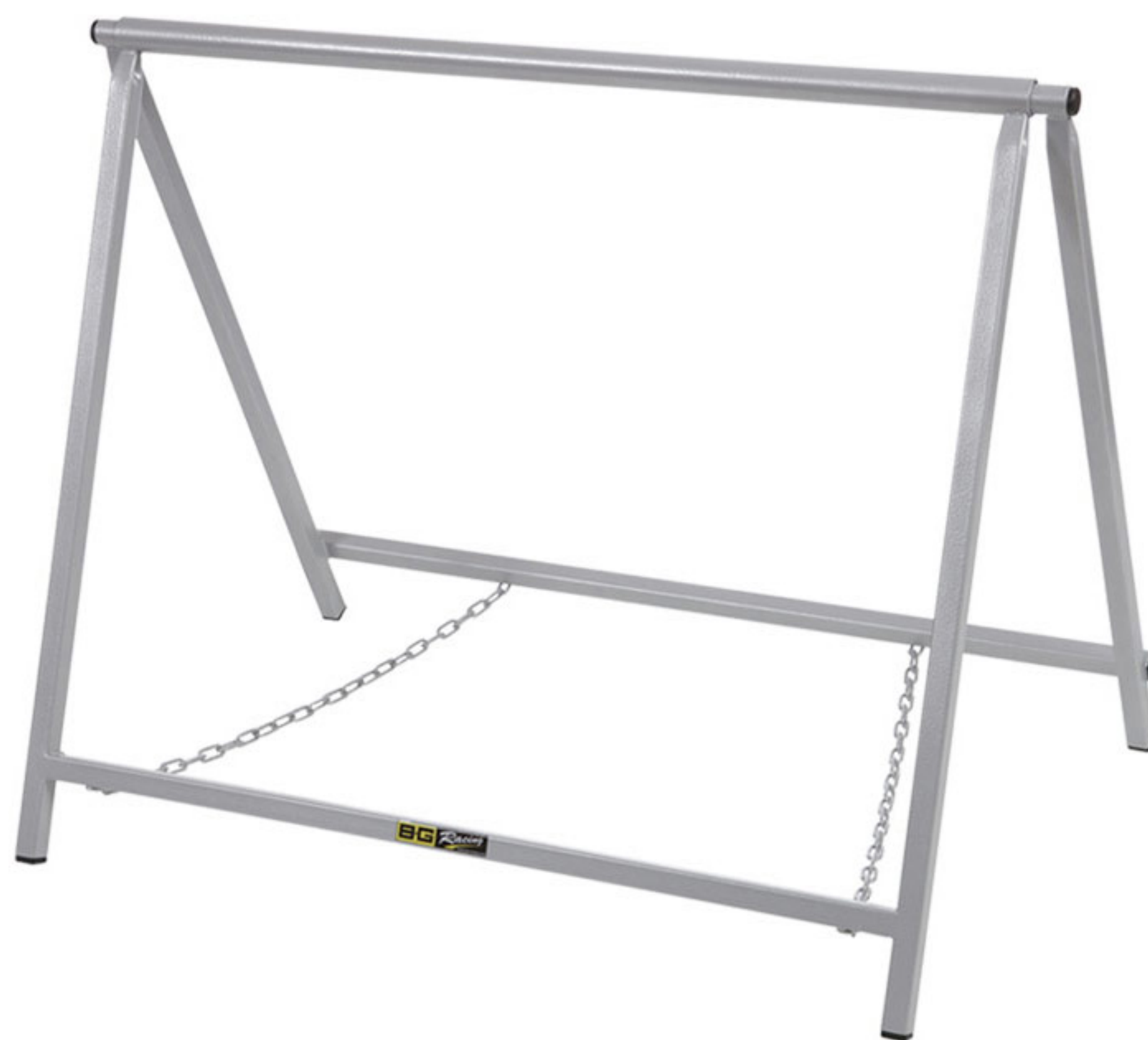
BGR125P / BGR125RED