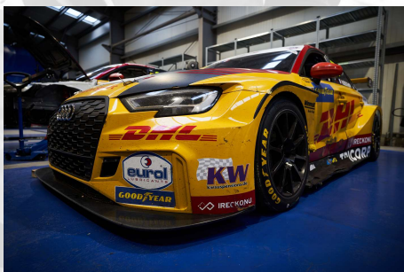
Audi RS 3 LMS